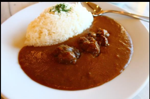
◆自家製ビーフカレー