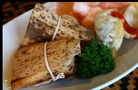
◆中華ちまき&揚げ餃子