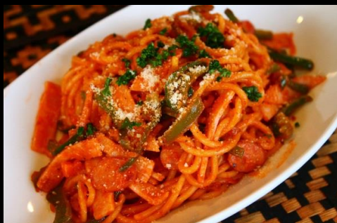
◆スパゲッティナポリタン